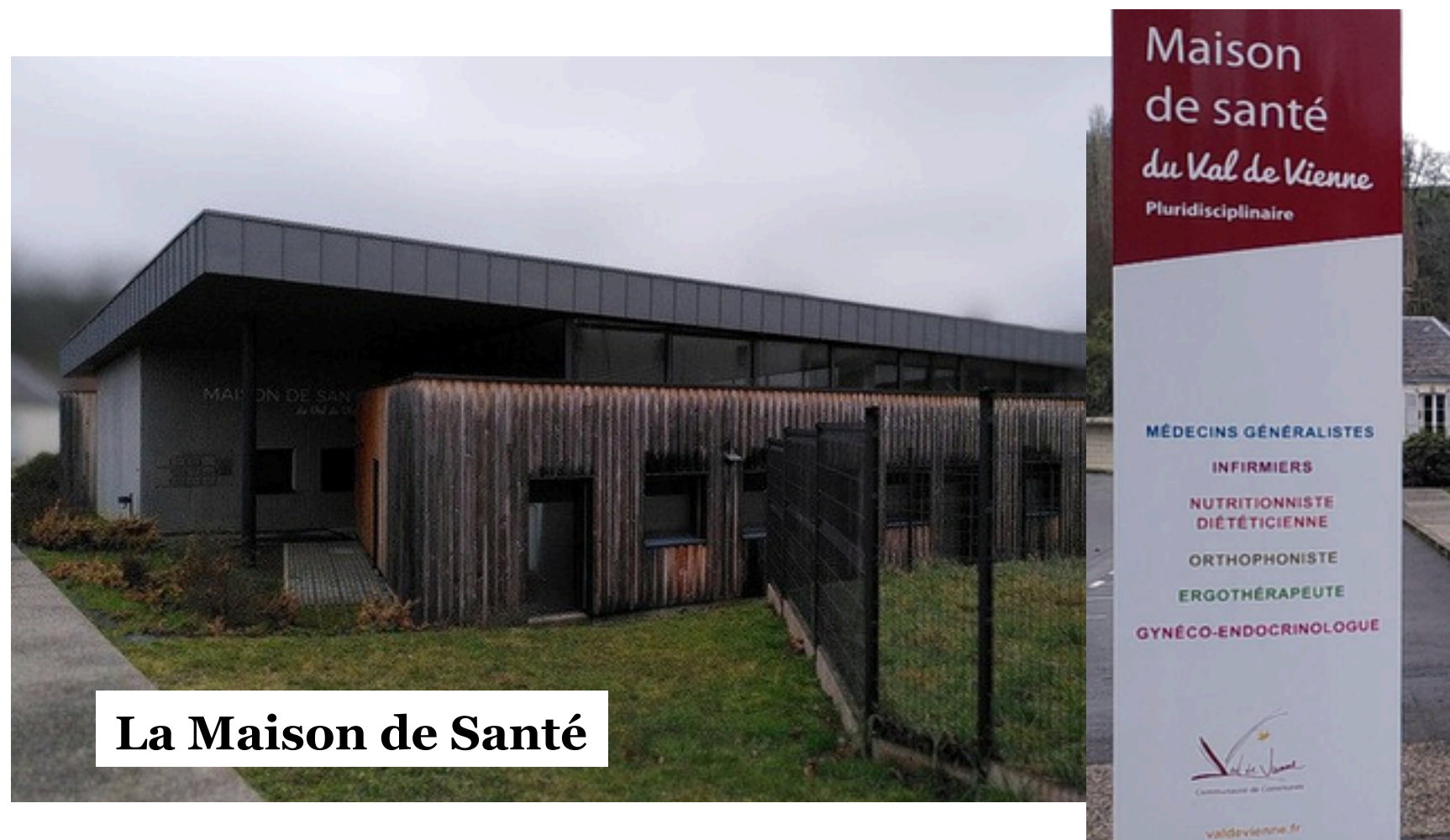
La Maison de Santé